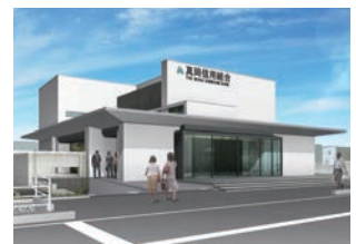
益子支店新店舗(イメージ)

令和2年4月の益子支店移転に向けて、現在、新店舗を建設中です。モダンでお年寄りや障がい者の方にもやさしい建物です。